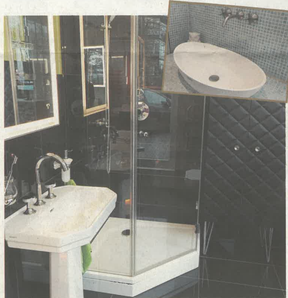
Schwarz bleibt Trend bei der Ausstattung des individuellen Wohlfühl-Badezimmers. Ein Besuch lohnt sich. Im Badstudio von Jens Gottschalk in Norderstedt kann man sich inspirieren lassen, wenn es um neue Ideen fürs Bad geht. Bild oben: Mosaik-Fliesen sind bei kleinen Flächen immer noch ein Hingucker

„Im Bereich der Dusch-WCs sind Produkte der Marken Toto, Geberit und Duravit beliebt. Dank sanfter Reinigung mit warmem Wasser sorgt das Dusch-WC für mehr Sauberkeit und Hygiene. Diese modernen Toilettenmodelle sind eine papierlose All-in-one-Lösung und daher besonders nachhaltig. Dusch-WCs sind platzsparend, da kein separates Bidet im Badezimmer benötigt wird“, sagt Badplanerin Wally Knappe. In der kommenden Saison wird aus dem Vollen geschöpft: Kräftige Farben wie Royal Blue, Very Peri oder ein klassisches Schwarz sind Trend im Bad. Die Farbe Schwarz greift nun auch auf die Keramik über, Individualität wird noch größer geschrieben und das Bad avanciert endgültig zu einem vollwertigen Wohnraum. Der ideale Gegenpol zum hektischen Alltag ist ein natürlich gestaltetes Badezimmer mit Spa-Faktor. Besonders gut lässt sich der erreichen, wenn man Wände und Boden nicht fliest, sondern flächig verputzt. Weich und angenehm fühlt sich Kalkmarmorputz an, der vom Fachmann ähnlich der traditionellen Fresco-Technik mehrfach aufgetragen wird. Er ist bestens für Nassräume geeignet ist und kann mit Pigmenten eingefärbt werden. Die Kombination von Natur- und Pastelltönen bei Badmöbeln und Accessoires wirkt harmo-