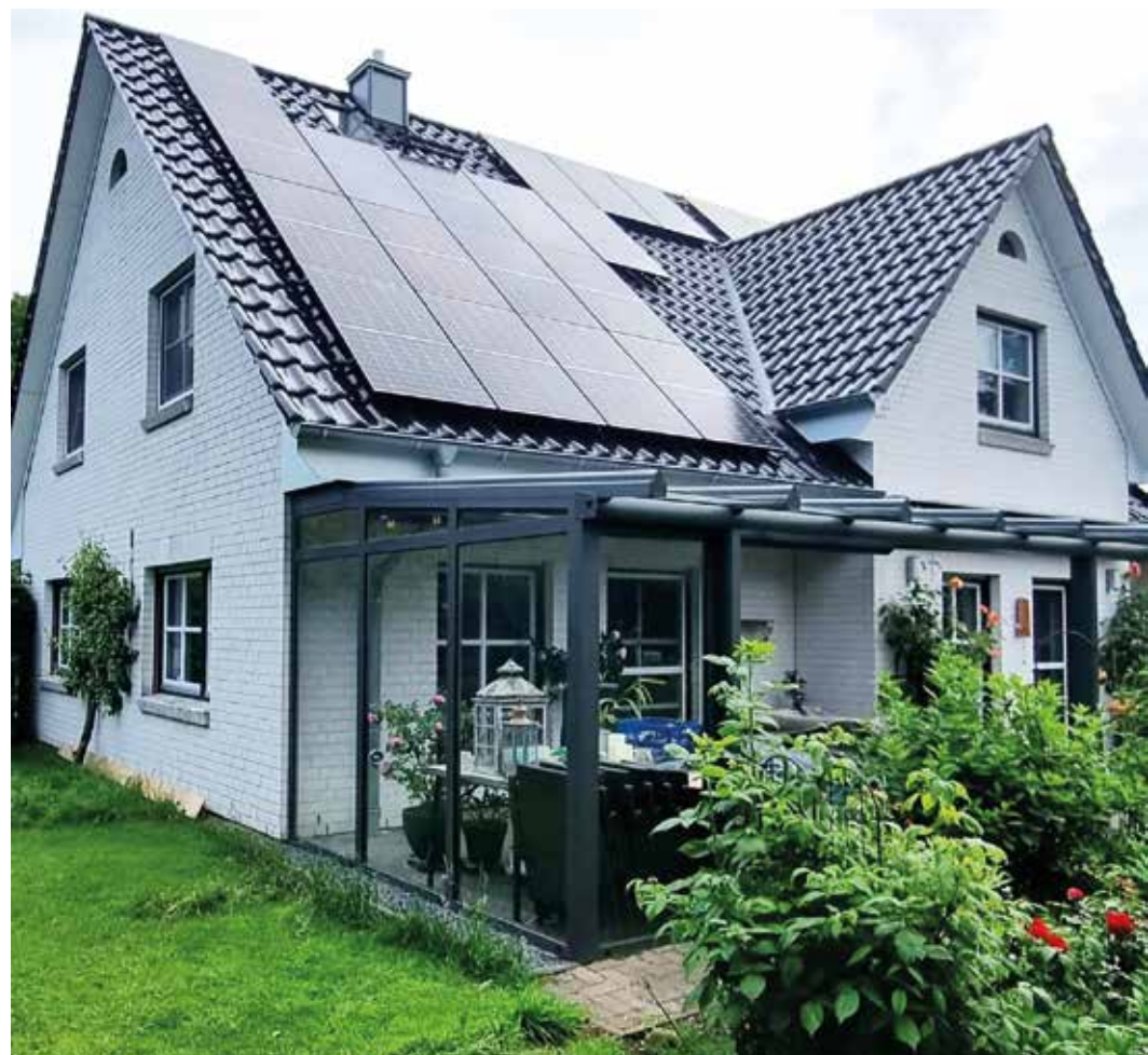
Effiziente, nachhaltige Wärmegewinnung interessiert inzwischen alle Immobilienbesitzer. Mit einer Photovoltaik-Anlage kann der eigene grüne Strom für die neue Wärmepumpe produziert werden