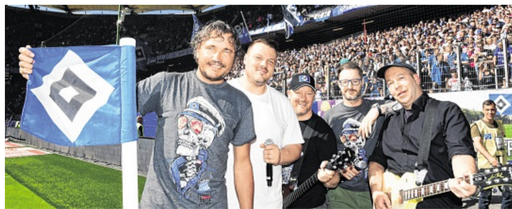
Die Band Abschlach! bei ihrem Liveauftritt vor der Nordtribüne im Volksparkstadion im April 2018.